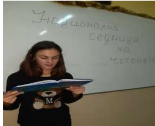
„Приказка за свободата”