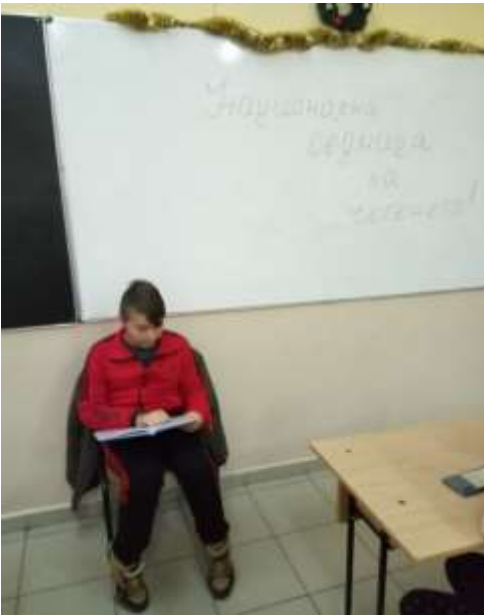
„Приказка за любовта”