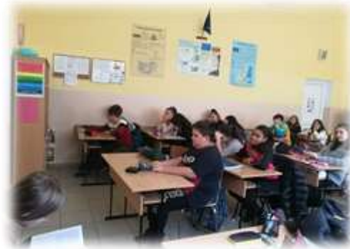
„Приказка за най-големия враг“