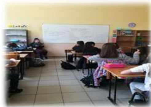
„Приказка за простотата и простотията“